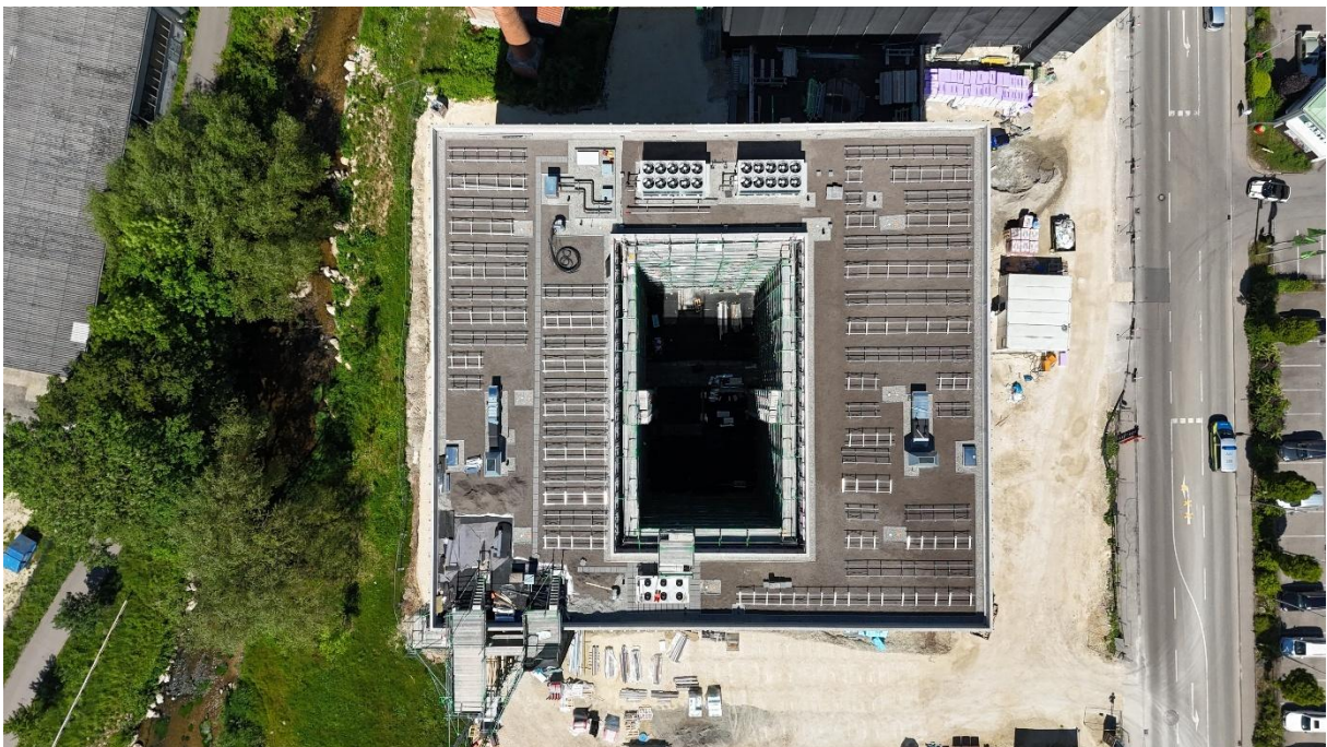
Draufsicht Gebäude 2 mit den beiden Luftwärmepumpen (am oberen Bildrand)