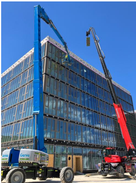
Montage der Konsolen