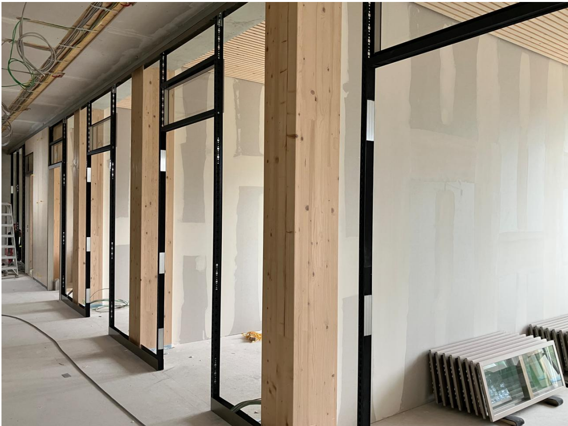
Trockenbauarbeiten: Einbau der Bürotrennwände und Decken in den Fluren (Gebäude 2 - 1. OG)