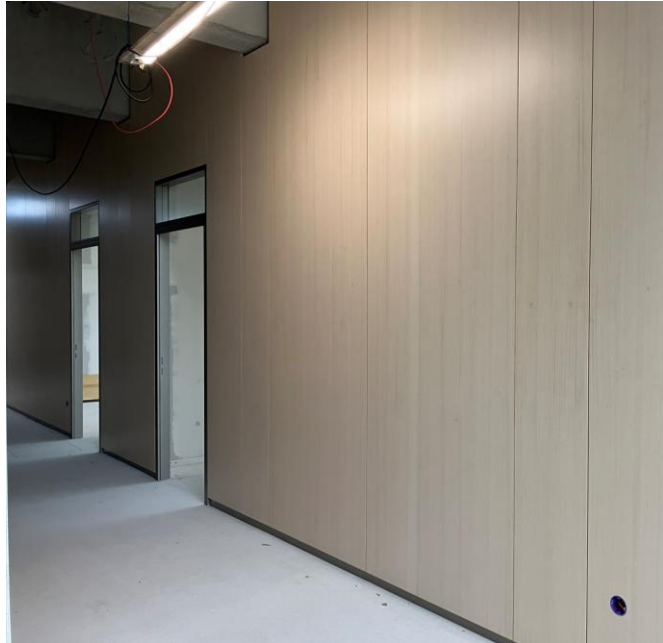
Gebäude 2 (Erdgeschoss)