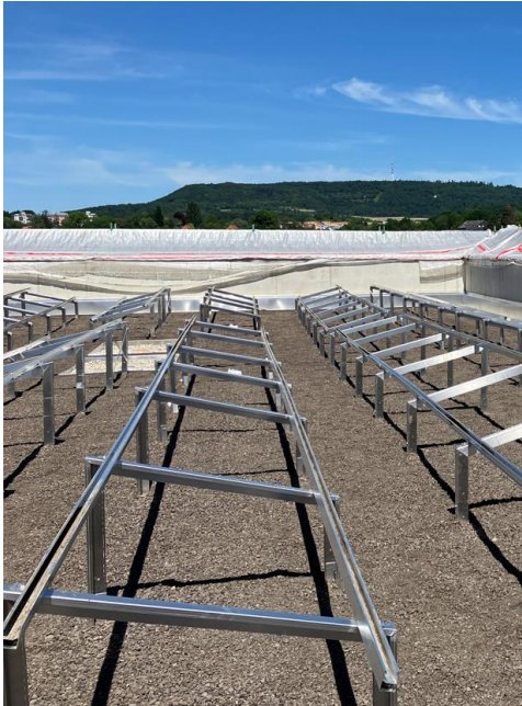
Unterkonstruktion der PV-Anlage