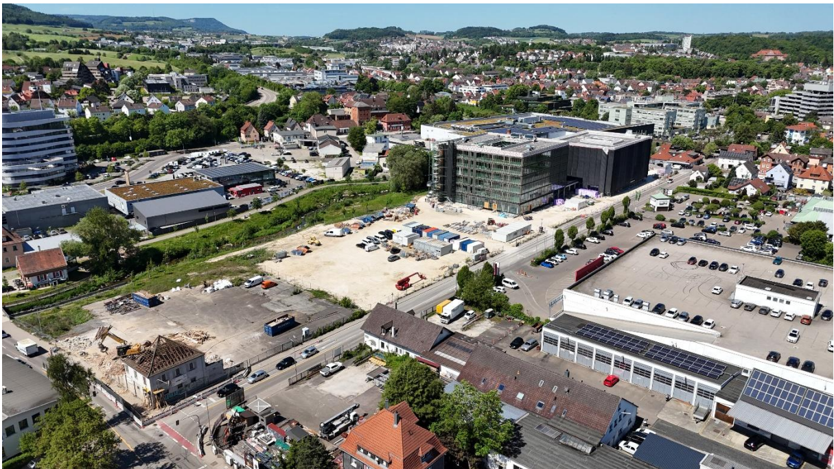
Gesamtperspektive mit Blick auf das ehemalige Union-Gelände: vorne links noch letzte Abbrucharbeiten beim angrenzenden „Mühlich-Areal“, daran anschließend die Freifläche für die Errichtung der Park- und Mobilitätsstation (22.05.2026)