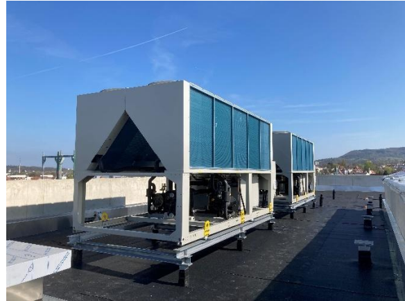
Anlieferung und Installation der beiden Luftwärmepumpen (16.04.2026)