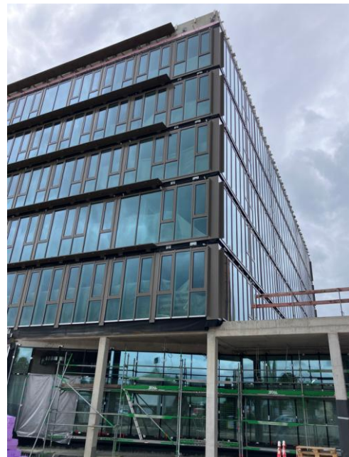
Fassade Gebäude 2