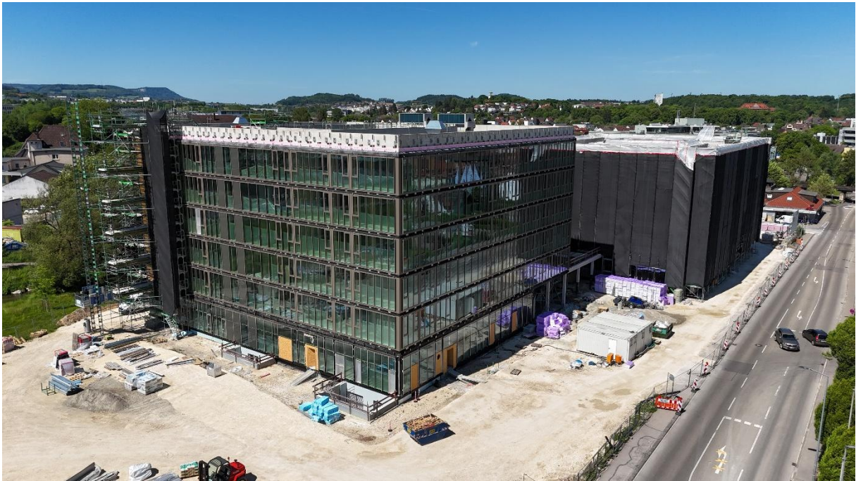
Perspektive der beiden Verwaltungsgebäude des Zweiten Verwaltungsstandortes (22.05.2026)