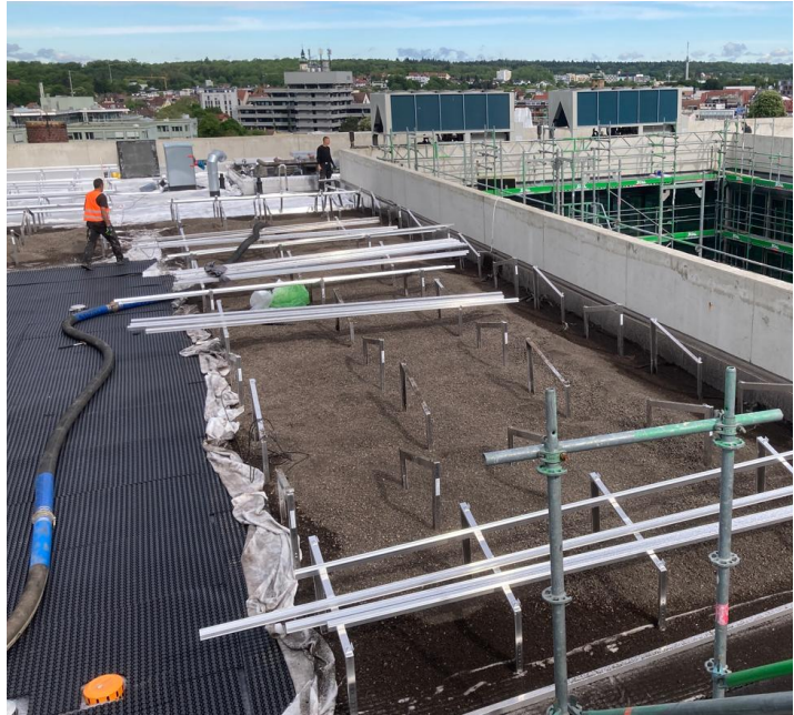
Aufbringung des Substrates (extensive Dachbegrünung)