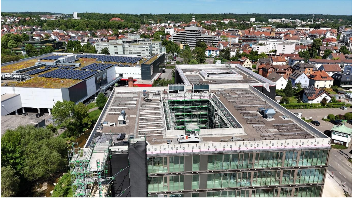
Vorbereitete Unterkonstruktion für die Photovoltaikanlage