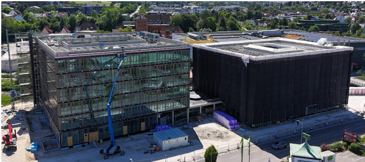
Montage der Konsolen an Gebäude 2 für den Sonnenschutz und die Großlamellen (28.05.2026)