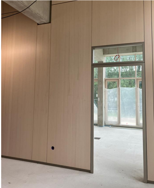
Einbau erster Systemtrennwände im