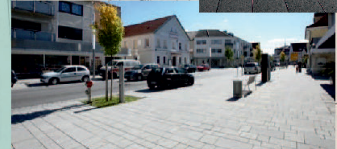
Zugänge, Wege ...