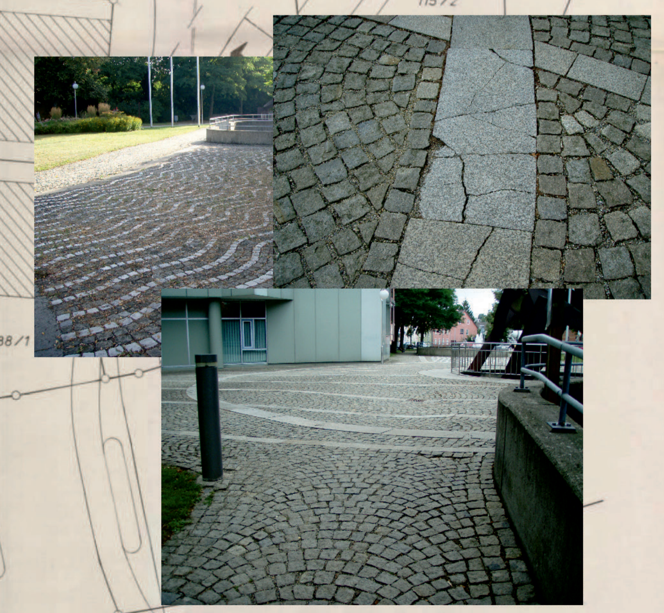
Zugänge, Wege ...