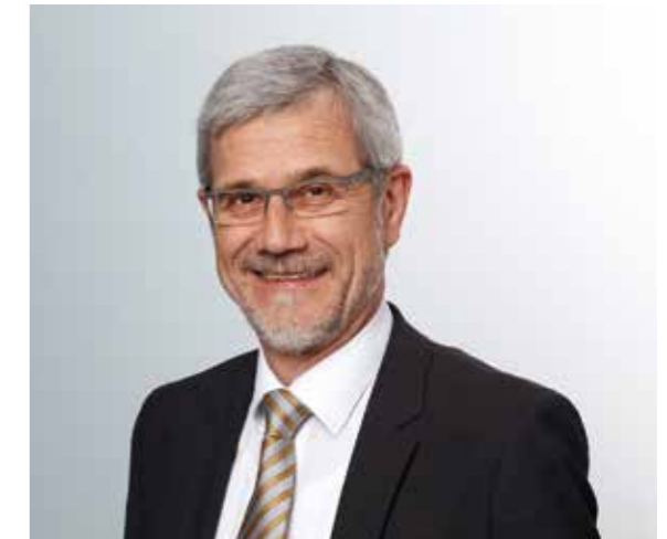
Aalen, 17. Juni 2016

Der Verwaltungsrat spricht dem Vorstand sowie allen Mitarbeiterinnen und Mitarbeitern seinen Dank aus. Ein großer Dank gilt besonders allen Kunden und Geschäftspartnern für die vertrauensvolle Zusammenarbeit im Geschäftsjahr 2015.