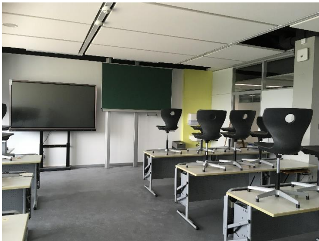
BA1: fertiggestelltes Klassenzimmer mit aktueller Medientechnik