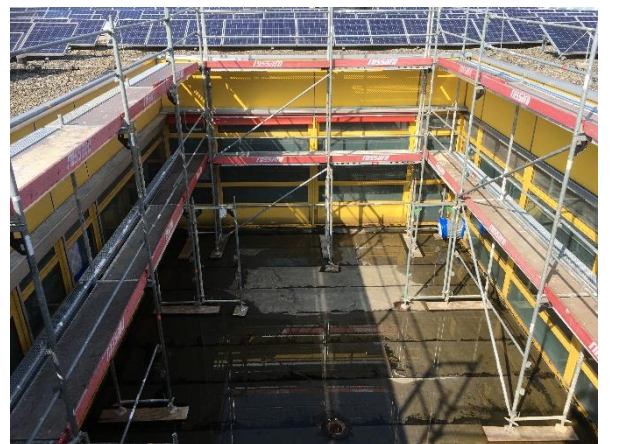
BA2: Baugerüst im Innenhof