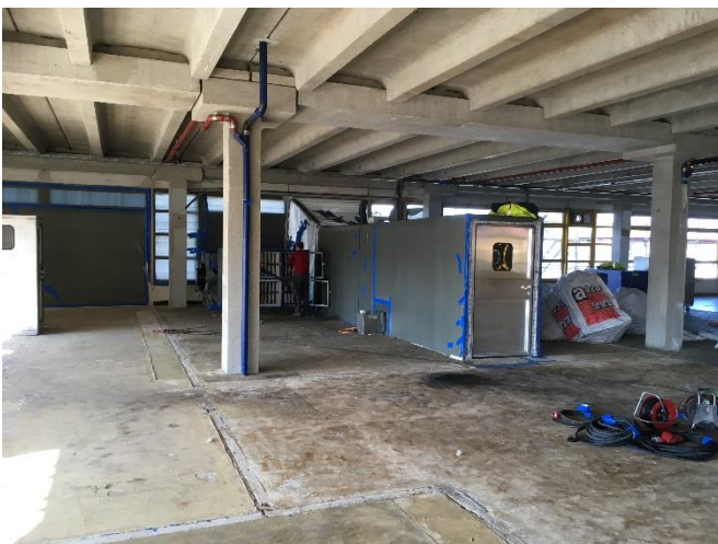
BA2: Abschluss Rückbau bis auf Rohbau