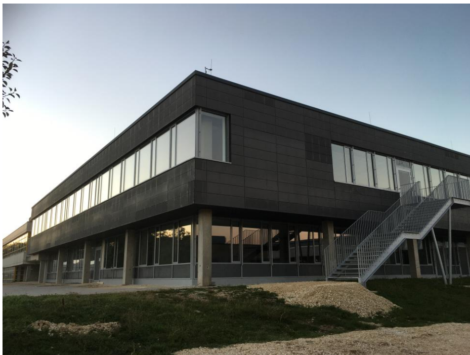
BA1: fertiggestellte Außenfassade inkl. Fluchttreppe