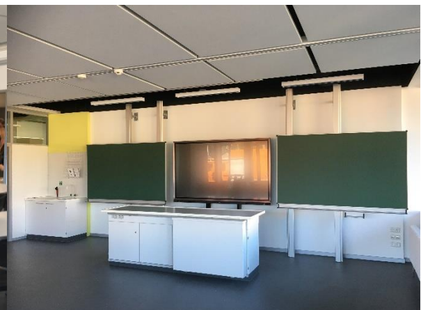
BA1: fertiggestellter Fachraum Biologie