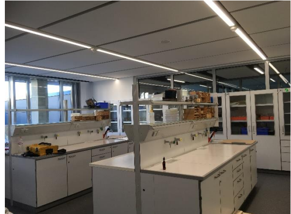
BA1: fertiggestelltes Labor für Chemie