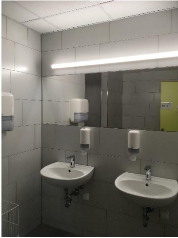
BA1: Neuer Sanitärbereich