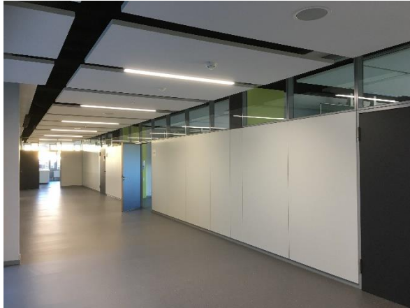
BA1: Fertiggestellter Flurbereich mit Deckensegel, LED-Beleuchtung, neuen Systemtrennwänden und neuem Bodenbelag