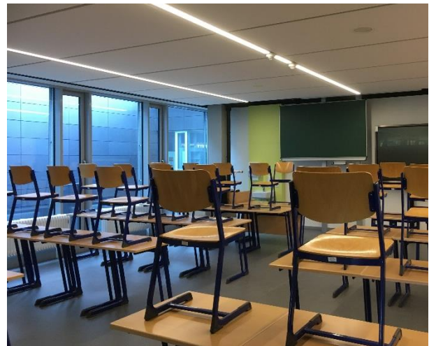
BA1: fertiggestelltes Klassenzimmer zum Innenhof