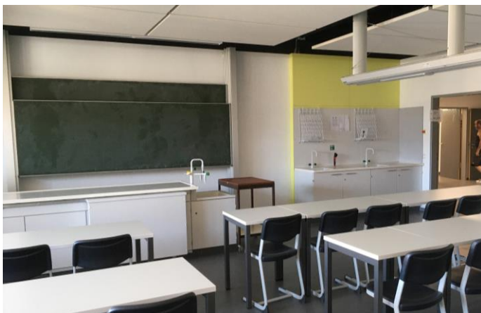
BA1: fertiggestellter Fachraum Chemie