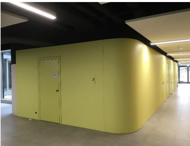
BA1: WC-Kern mit neuer Wandverkleidung