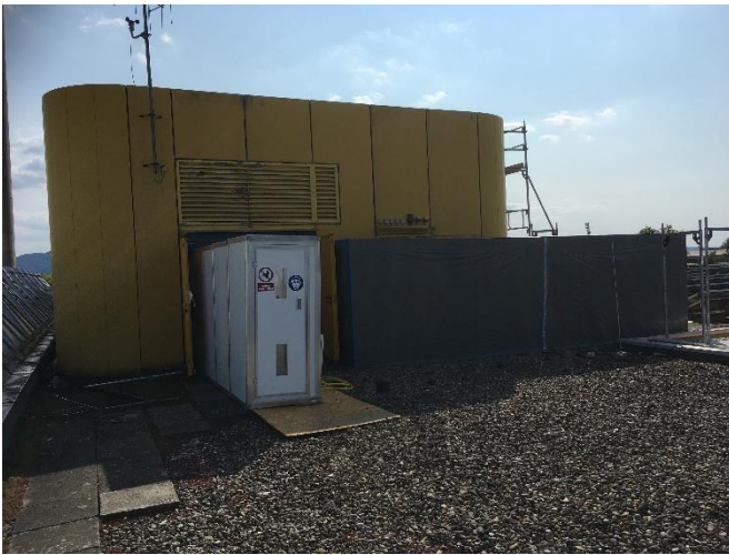
BA2: Schadstoffsanierung Lüftungszentrale