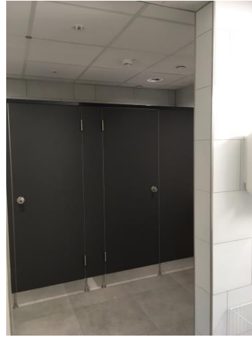
BA1: Neuer Sanitärbereich