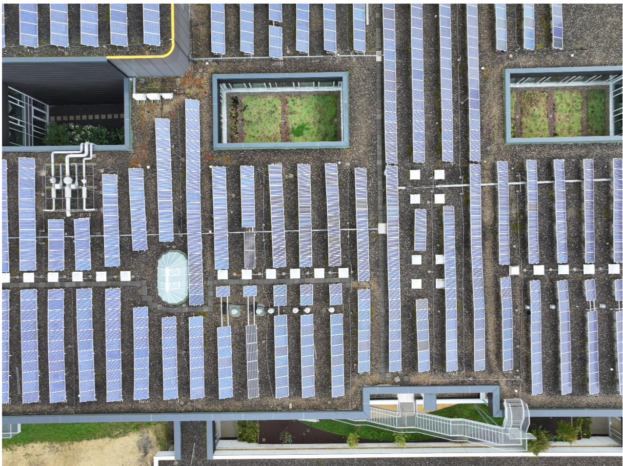
Abbildung 3: Zentraler Bereich westliche Dachfläche mit Technikaufbauten Sonderabluft (links, unterhalb des Innenhofs)