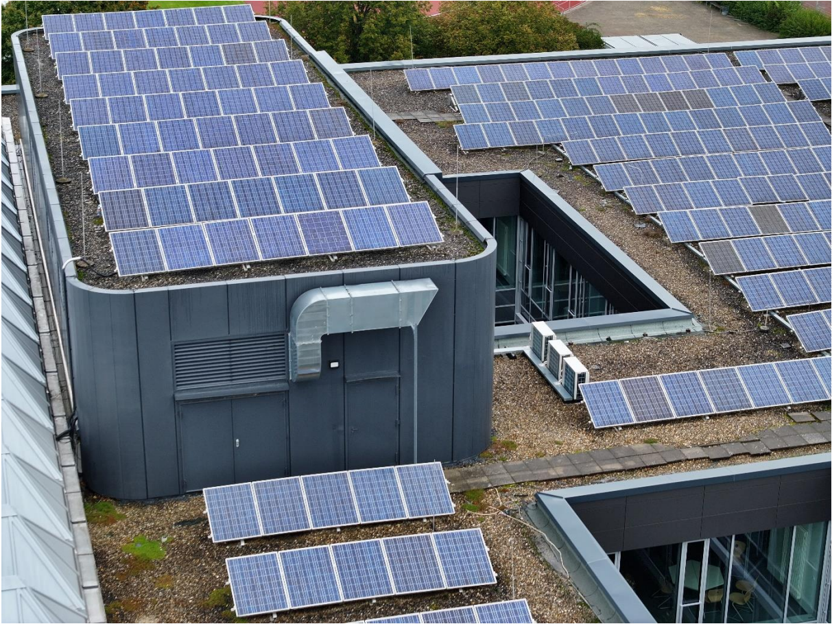
Abbildung 4: Technikzentrale (Nord-Ost)