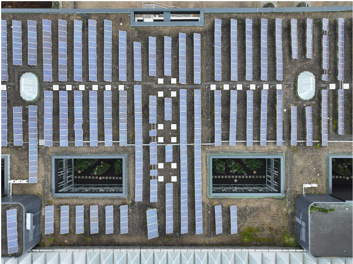
Abbildung 2: Zentraler Bereich östliche Dachfläche mit Klimasplitgeräten (oberhalb der Technikzentralen)