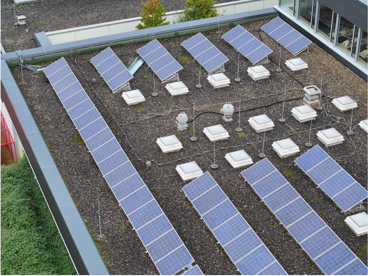
Abbildung 5: Werkstattdach Süd mit Lichtkuppeln, Abluftventilatoren, Fangstangen Blitzschutz und PV-Modulen