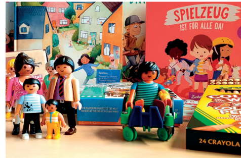
Inhalt der Diversity Box

Zielgruppen: alle Bürgerinnen und Bürger