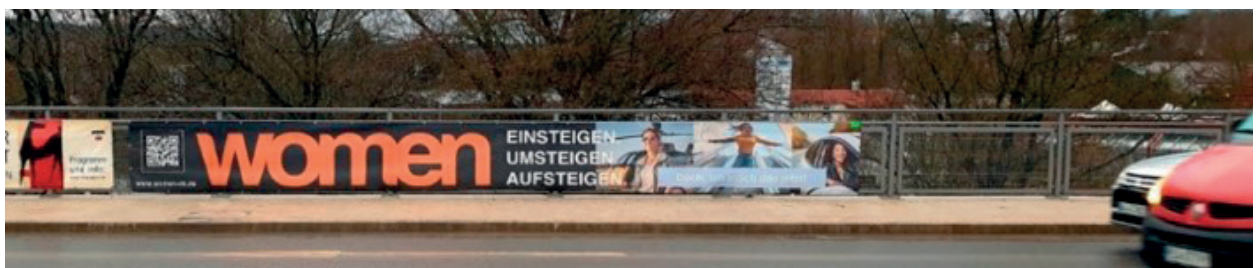
Werbung für die Kampagne WOMEN.