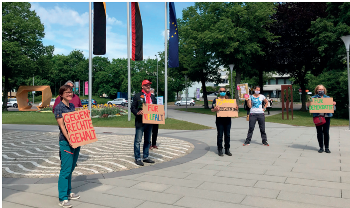
Netzwerk für Demokratie im Ostalbkreis vor dem Landratsamt zu 75 Jahre Frieden.