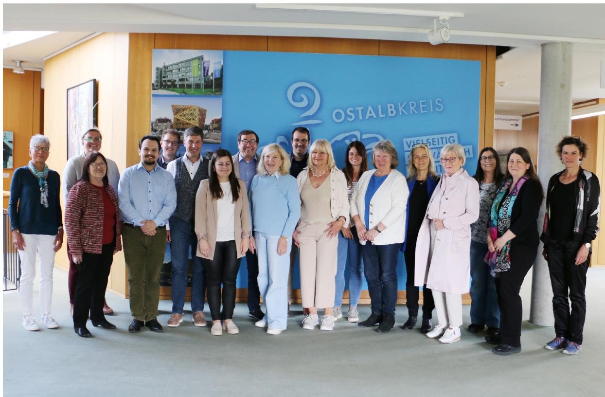
Die Gleichstellungskommission am 07.05.2025 bei der Erstellung des 3. Gleichstellungs-Aktionsplans