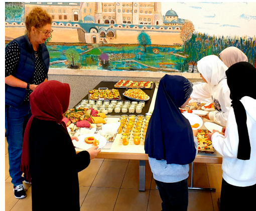
Gesundes Frühstück in der DITIB-Moschee in Aalen.

Zielgruppen: Kinder und Familien; Teilprojekt: Migrantenvereine