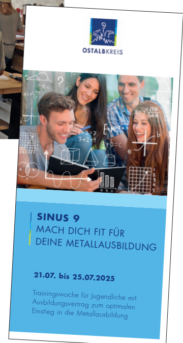
Flyer SINUS 9